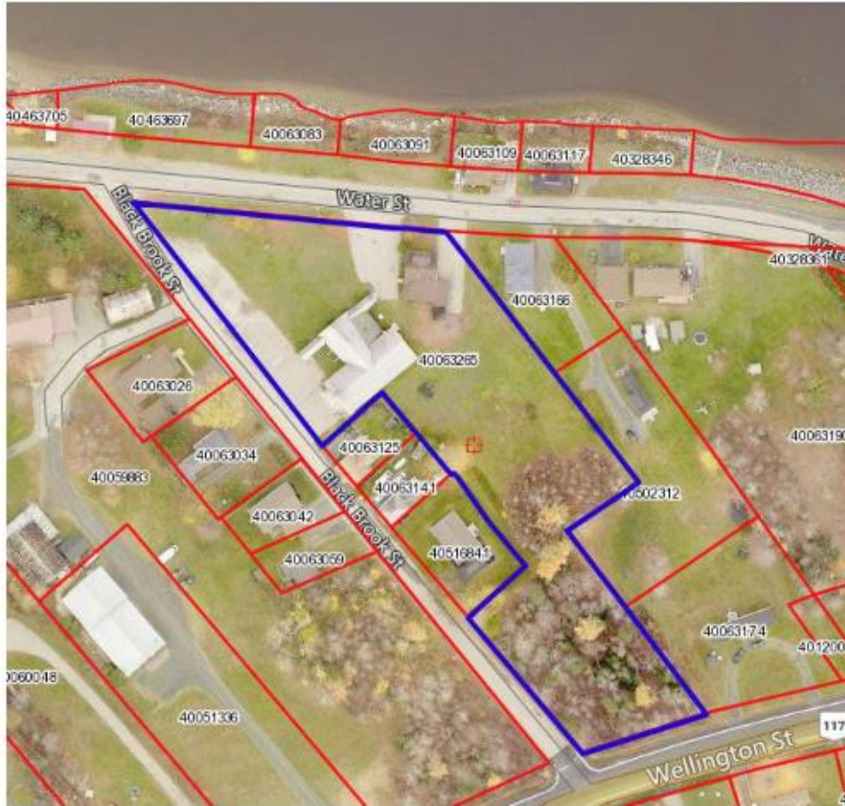
Figure 2: Oblique Aerial Image of Subject Properties outlined in blue